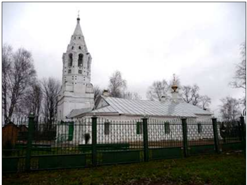
Покровский храм (г. Тутаев, Ярославская область)

Как в прошлые времена, так и сегодня, к данным и аналогичным чудотворным Богородичным иконам, по простонародному выражению названными «Подательница Ума», «Прибавление Ума», «Ключ разумения», стекаются и обращаются с молитвою не только душевнобольные, но и родители, замечавшие у детей неразумие, скудоумие, неуспешность в усвоении начальных основ веры и грамотности [Там же. С. 3].