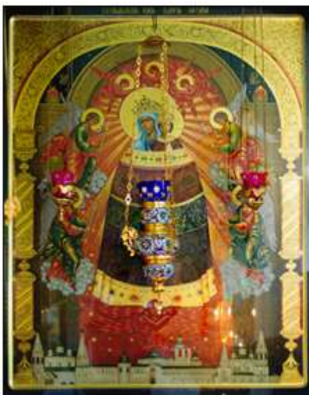
Икона «Прибавление Ума» (г. Ярославль)

Поступила в редакцию: 30.09.2013 Прошла рецензирование: 15.10.2013 Опубликовано: 31.10.2013