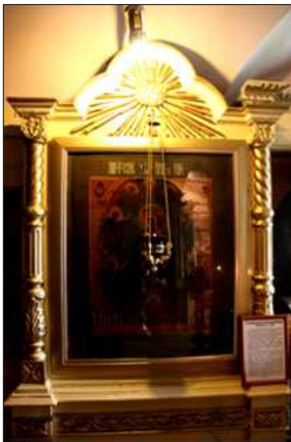
Икона «Прибавление Ума» (г. Тутаев)

В наши дни подобные варианты иконы достаточно редки, но их, вероятно, «первые образцы» известны и почитаемы в городах Ярославской области, расположенных на берегах Волги. «Подательница ума» сохранилась в Спасо-Преображенском соборе г. Рыбинска, другая — в Покровской церкви в небольшом городке Тутаеве (быв. Романово-Борисоглебске). Современный вариант иконы представлен в церкви Спас на Городу (Ярославль).