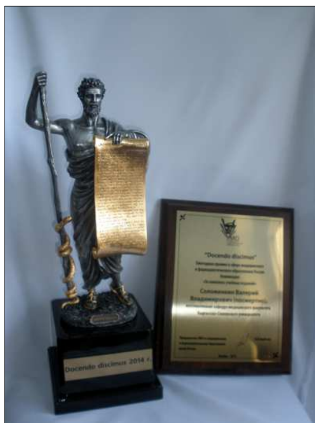
Annual award in sphere of medical and pharmaceutical education in Russia "Docendo discimus" ("While teaching, we are learning") in the nomination "For a set of textbooks"

Organized in collaboration with Clemens University (USA) Center for children with autism uses innovative methods of applied behavioral analysis, and actively involves the work of students and graduates of AUCA.